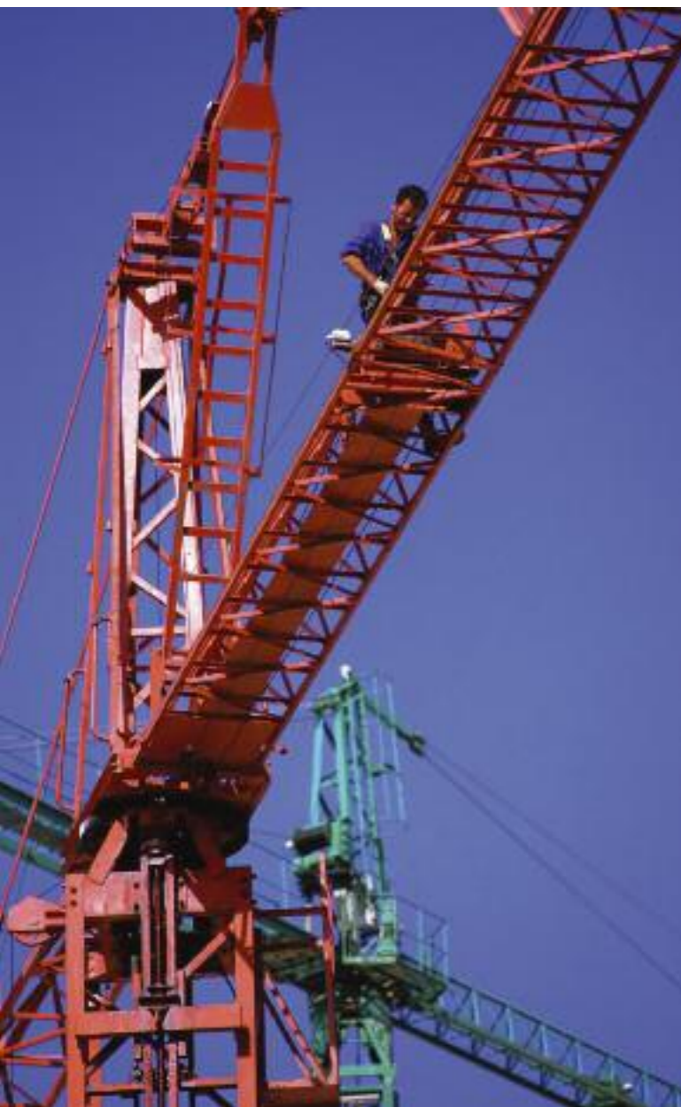
Quer durch alle Marktbereiche wissen die Kunden, dass sie von Perkins nicht nur einfach einen Motor erwerben - es ist vielmehr eine komplette Antriebslösung, die Fachleute auf die jeweiligen Gegebenheiten genau abgestimmt haben

Da Perkins sich auf die Produktion von Motoren konzentriert und keine kompletten Maschinen baut, ist eine umfassende Palette von Antriebslösungen entwickelt worden, um so den Anforderungen eines sich ständig ändernden Marktes gerecht zu werden. Den heutzutage auf drei Kontinenten von Perkins-Fachleuten produzierten Motorlösungen vertrauen über 1000 führende Hersteller in allen Industriezweigen.