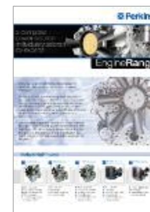
Publikation Nr. PN1891