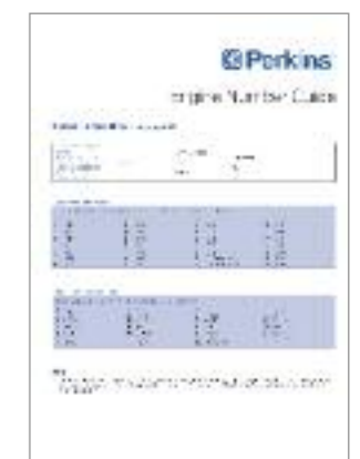
Publikation Nr. PP827