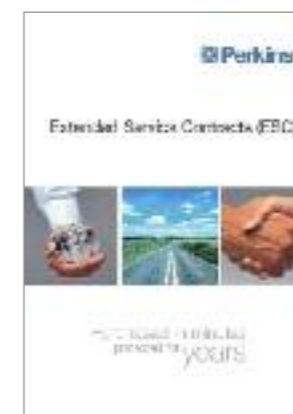
Publikation Nr. PP1107

Beim exzellenten Product Support dreht sich alles um das Engagement für unsere Kunden; wir geben ihnen die Gewissheit, dass wir ihre spezifischen Bedürfnisse verstehen und dass unsere Motoren ihre Maschinen in Betrieb halten.