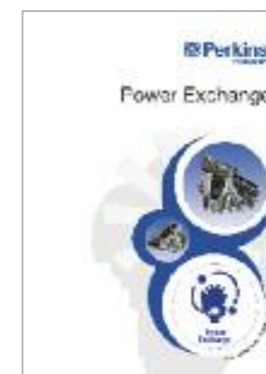
Publikation Nr. PP1144